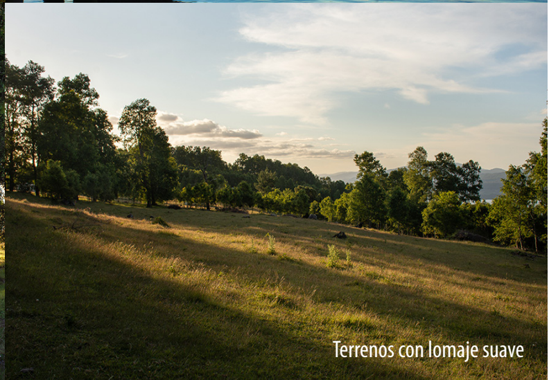
Terrenos con lomaje suave