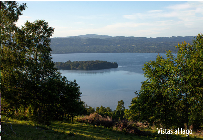
Vistas al lago