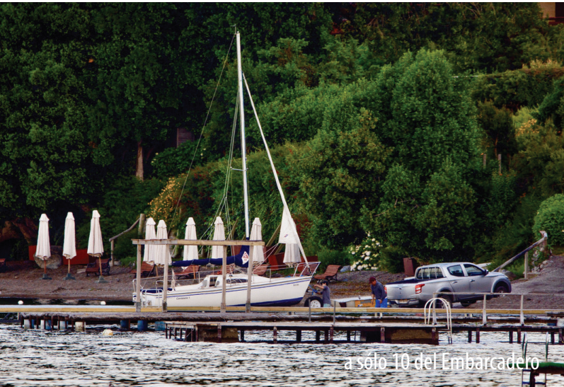
a sólo 10 del Embarcadero