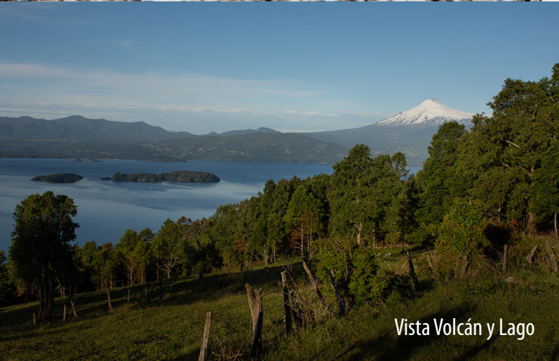
Vista Volcán y Lago