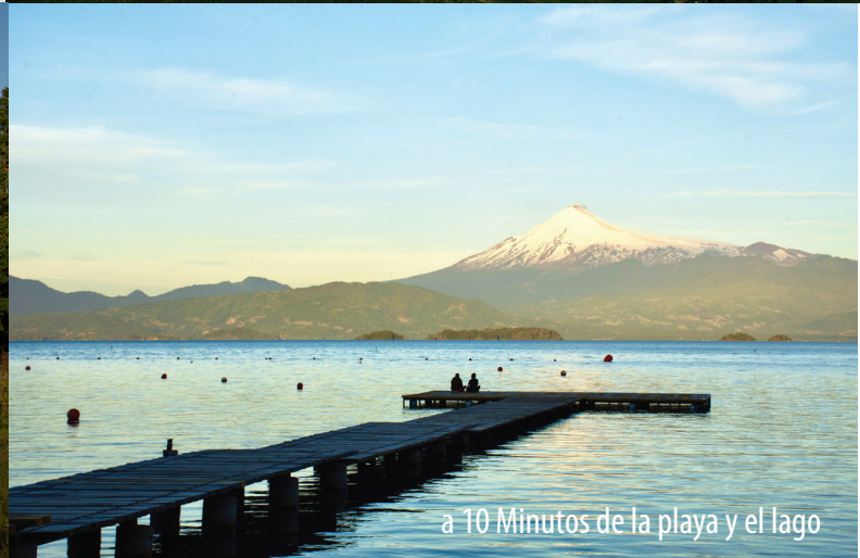
a 10 Minutos de la playa y el lago